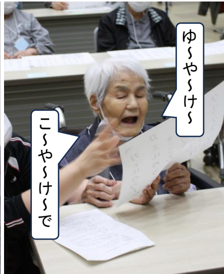
大きな声で歌いました♪