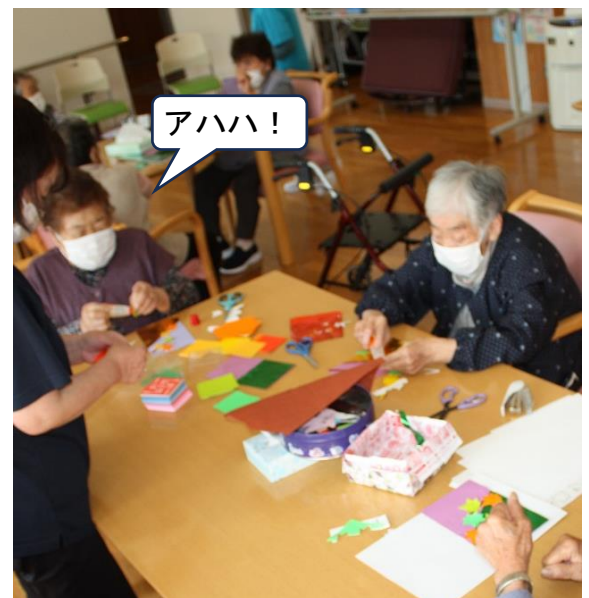
手も口も動いて楽しそうですね。