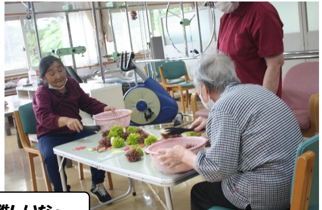
栗拾いは難しいな～