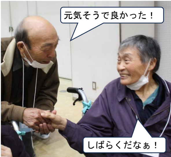
手を取り再会を喜び合いました。

10月1日（水）、岩手広域交流センター「プラザあい」を会場に、あんずの里・岩手町デイサービスセンター・東部デイサービスセンターの利用者さんが一堂に会し、三事業所合同交流会を開催しました。全員でラジオ体操や輪唱をしたり、職員による余興を見たりするなど、楽しいひと時を過ごしました。また、久しぶりにお会いする方とお話をするのもでき、交流を深める良い機会にもなりました。